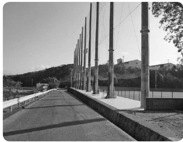
南山スポーツ公園野球場防球ネット

完了を予定している。 ●笠松農業用水及び公共用水管理運営特別会計補正予算(第2号) 歳入歳出予算にそれぞれ28万円を追加し、予算総額1780万2千円とするものです。 内容は、電気料金高騰分の増額によるものです。 (賛成全員) ●国民健康保険事業特別会計補正予算(第3号)