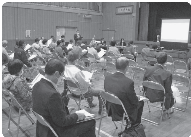
学校統合再編地区説明会(美山地区)