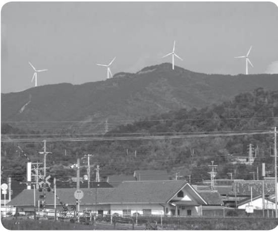
白馬山脈の風力発電施設

まで把握しているのか。この尾根すじは、県が計画する広域林道と同一線上となる。建設も同時期で、風力発電のための道路とも受け取られるのではないかと答へ、事業者から、今年6〜8月にかけて関係地区や地権者に概要説明を行ったと聞いているが、町としては、住民に広く丁寧の説明をするようお願いをしている。