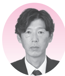
山本 芳徳 議員