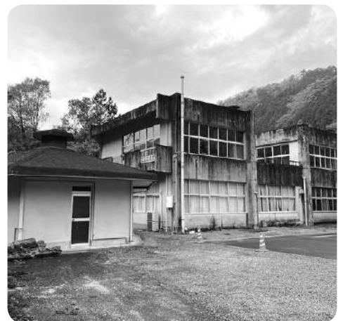
旧寒川中学校校舎等