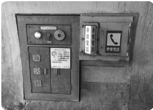
トンネル内の非常電話