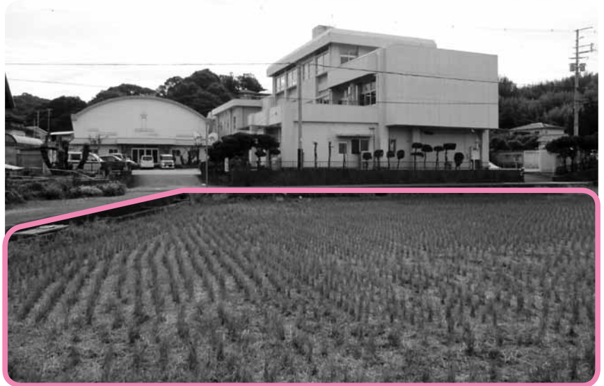
和佐小学校バスターミナル・駐車場予定地(田部分)