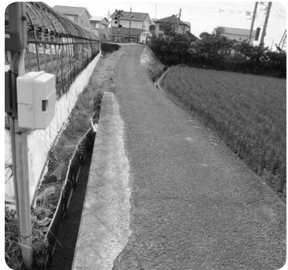
認定された土生藤井線

問 今後の拡幅工事はどうするのか。 答 半分が御坊市の市道となっているが、区域を超えて日高川町の町道とすることについて、市議会で可決されている。