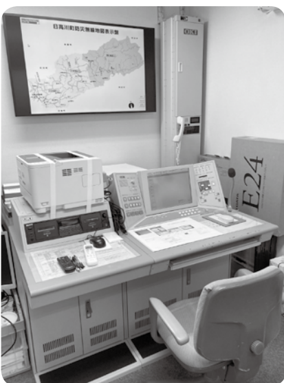
庁内の防災無線室