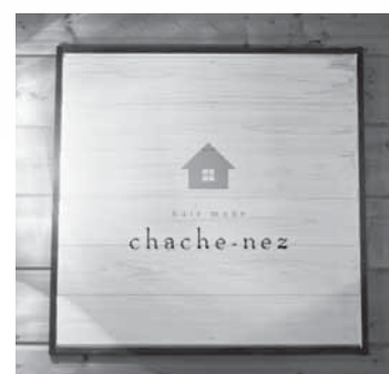
店の扉を開くと出迎えてくれる看板

「三百瀬で美容院を営むことになったきっかけは?」 以前は御坊市内の美容院に勤めていたのですが、子どもがまだ小さかったので、帰る時間が遅くなると、どうしても子どもに世話をしてもらっている家族に負担がかかってしまいました。自宅で子育てをしながら仕事が出来るのが理想だし、いざそれは独立して自分の店を持ちたいという目標があったので、2013年に「ヘアメイクカシユネ」をオープンしました。