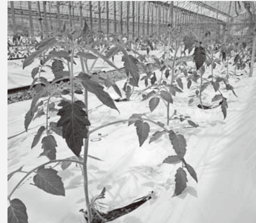
お問い合わせ 農業振興課 ☎0738-22-2048